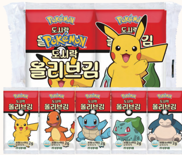
올리브 도시락김 2g X 20봉