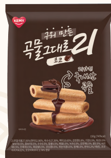
구워만든 곡물그대로21 초코 10g X 15개