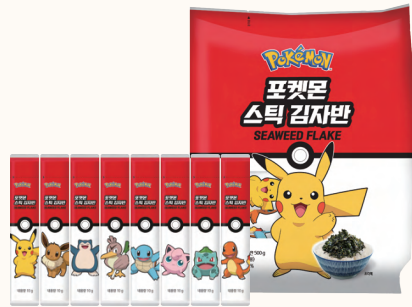
포켓몬 스틱 김자반 10g X 50봉