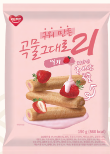
구워만든 곡물그대로21 딸기 10g X 15개