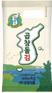
곰창돌김 4g X 100봉